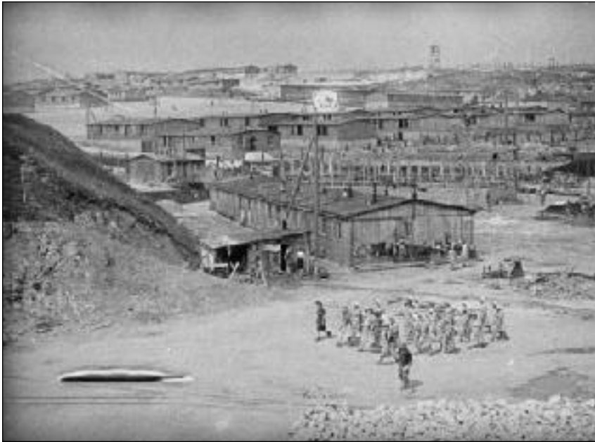
Camp de concentration d'Auschwitz en Pologne

Cependant l'hiver est là. La libération qui nous paraissait si proche semble s'éloigner de nous. Les Allemands parlent d'une arme secrète, plus terrible encore que les V1 et V2. Malgré les bombardements alliés, notre moral baisse. Ces bombardements sont la terreur des Allemands et ce doit, il est vrai, être terrible. Toutes les nuits, nous entendons le vrombissement des avions passant par centaines au dessus de nos têtes et à haute altitude.