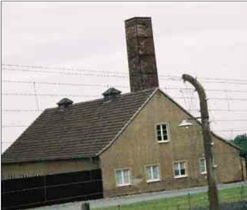
Crématoire dans les camps de concentration

Malgré la garde vigilante dont nous sommes l'objet et l'état physique dans lequel nous nous trouvons, deux internés réussissent le tour de force de s'évader. Et c'est réellement un tour de force. Les Allemands eux-mêmes sont sceptiques et c'est pourtant vrai. L'appel, ce soir là, dure six heures et il y a plus de cent morts sur la place d'appel lorsque nous sommes autorisés à rentrer dans nos baraquements, littéralement gelés et sans forces.