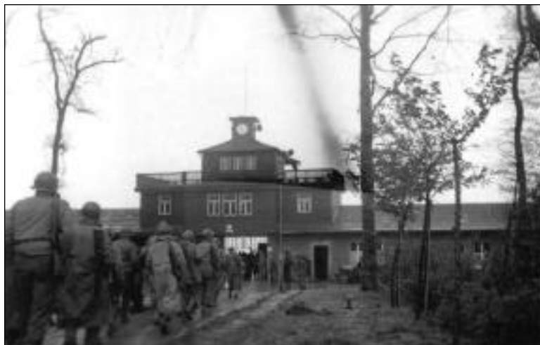
Entrée principale su camp de Buchenwald en Allemagne

On nous distribue des masques à gaz, on marque à la peinture les maisons dont les caves sont susceptibles de servir d'abris en cas de bombardement et on institue le «black-out.» Certains commerçants et particuliers prévoyants collent des rubans de papier au travers de leurs vitrines et de leurs fenêtres pour éviter les éclats de verre en cas de bombardement. Par ailleurs, tous les gens sont confiants que dans quelques semaines, quelques mois tout au plus, tout sera revenu dans l'ordre. La guerre sera terminée et l'Allemagne sera vaincue.