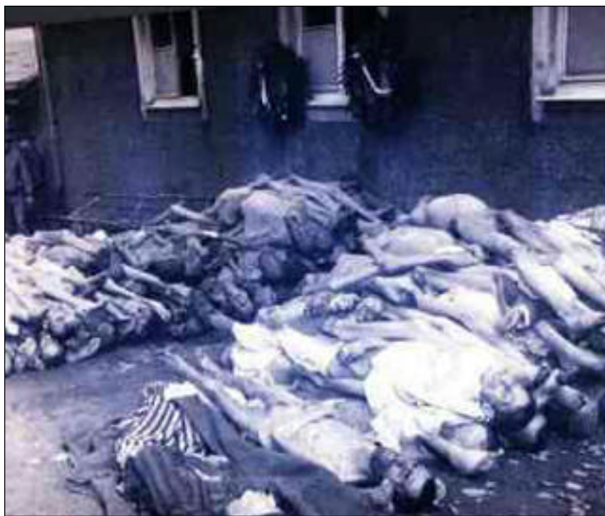
Amoncellement de cadavres dans un camp de concentration

Avec l'arrivée des ouvriers allemands, nous faisons connaissance avec les premiers Allemands sans uniformes. Au début, ils sont froids, distants et paraissent indifférents. Il est vrai que pour entretenir cette méfiance, on leur avait dit que nous étions tous des Russes. Comme le front russe commençait à s'effondrer, et la propagande aidant, les Russes étaient les sauvages à abattre. Ce en quoi, ils n'avaient pas tout à fait tort. Il est vrai que les Russes qui étaient en majorité parmi nous, pour la plupart jeunes et donc en meilleur état physique que nous. Peut-être étaient-ils plus habitués que nous aux travaux durs.