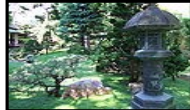
Jardin japonais du musée Albert-Kahn de Boulogne- Billancourt