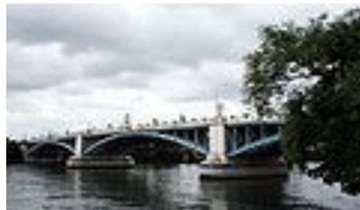
Le Pont d'Argenteuil