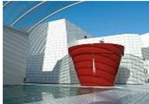
Mastaba 1 à La Garenne-Colombes