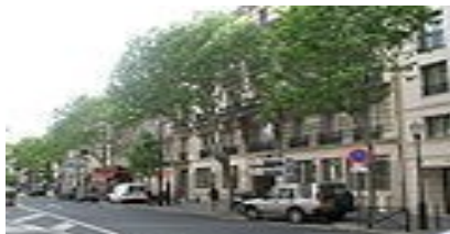
Boulogne-Billancourt, sous-préfecture des Hauts-de-Seine, ville la plus peuplée d'Île-de-France après Paris