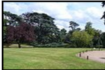
Parc de Saint-Cloud