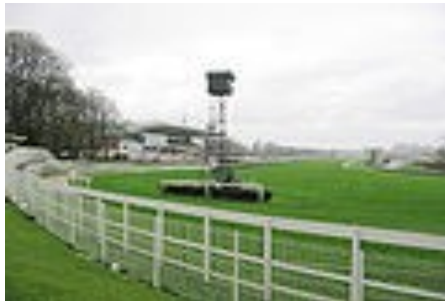
Hippodrome de Saint-Cloud