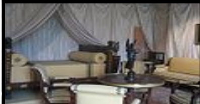
Chambre ordinaire de Joséphine au Château de Malmaison